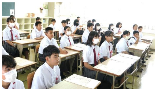
↑ 入学式後の4組 姿勢も良い

2024年、子どもたちが全力で学校生活が送れましたのも、保護者の協力があったからです。感謝申し上げます。保護者の皆様も、良いお年をお迎えください。