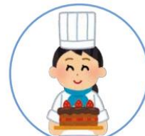
目標と学習をつなげる

将来なりたい自分に向かって、目標を決めることで、何を、どのように、どのくらい学習したらよいかが見えてきます。まだ未定の人でも、こんな人生を送りたいなあイメージするといいかも！